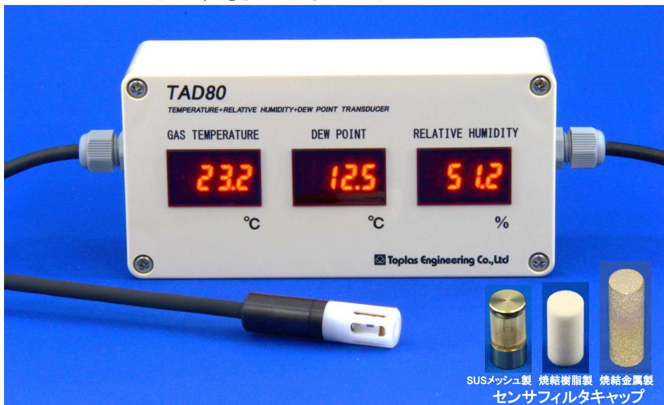
TAD80 (センサ部形状:標準、LED表示器:有り)とオプション例